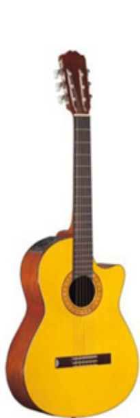
la guitare acoustique