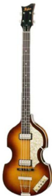
la guitare basse