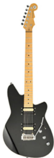
la guitare électrique