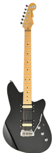
la guitare électrique