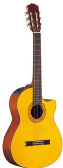
la guitare acoustique