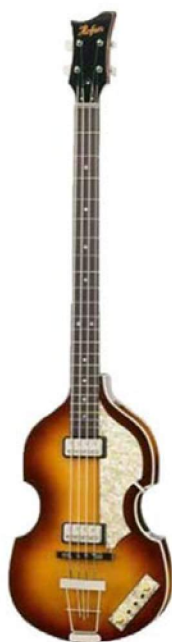
la guitare basse